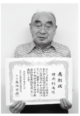
お 夫 氏 とし 利 ぶち 淵 ます 増

昭和43年〜塩谷町身体障害者福祉会理事 平成10年〜塩谷町身体障害者福祉会会長 平成11年〜塩谷町社会福祉協議会理事 平成14年〜 栃木県身体障害者福祉会 連合会評議員